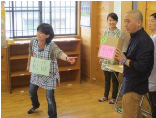
<スタッフによる寸劇>