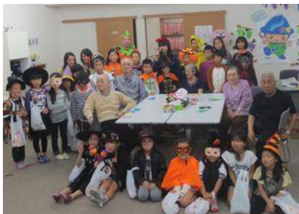
<デイサービスにて>