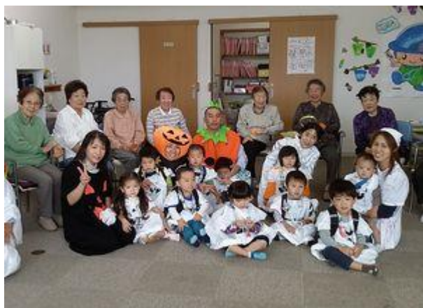
<デイサービスにて>